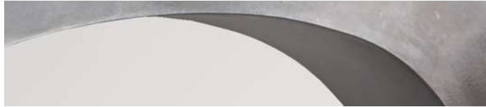
Alerta _____ página 46 Serie 2010 - 2016 Acero inoxidable y granito. (Altura, largo, prof.) 119 cm x 189 cm x 46 cm.