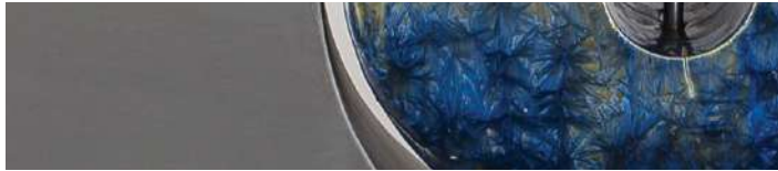
Cosmos ..... página 40 Serie 2010 - 2016 Mixta acero inoxidable y cerámica. (Altura, largo, prof.) 42 cm x 95 cm x 21 cm.