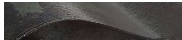
Agua ..... página 37 Serie 2010 - 2016 Acero inoxidable esmaltado al horno. (Altura, largo, prof.) 25 cm x 160 cm x 102 cm.