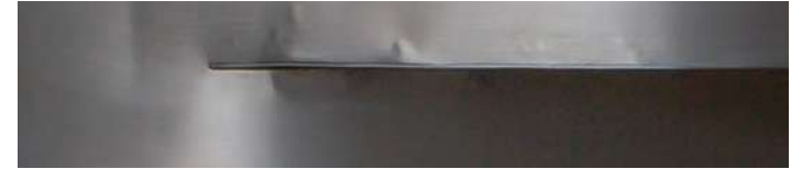
Él _____ página 49 Serie 2010 - 2016 Acero inoxidable. (Altura, largo, prof.) 82 cm x 89 cm x 53 cm.