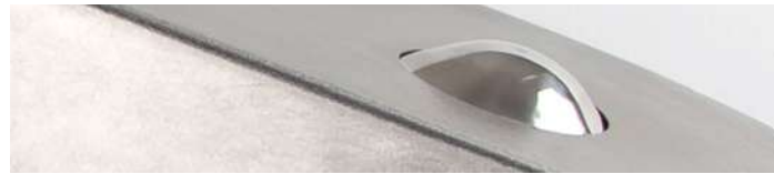
Playa ..... página 44 Serie 2010 - 2016 Acero inoxidable. (Altura, largo, prof.) 36 cm x 172 cm x 20 cm.