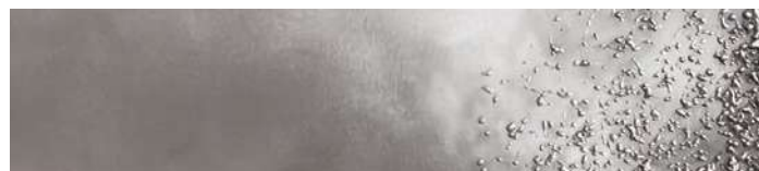
Mecánico ..... página 45 Serie 2010 - 2016 Acero inoxidable y granito. (Altura, largo, prof.) 122 cm x 217 cm x 83 cm.