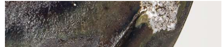
Estudio para 4 AM _____ página 50 Serie 2010 - 2016 Acero inoxidable esmaltado al horno y piedra. (Altura, largo, prof.) 87 cm x 61 cm x 24 cm.