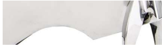
Estudio para Furia ..... página 43 Serie 2010 - 2016 Acero inoxidable y granito. (Altura, largo, prof.) 42 cm x 75 cm x 25 cm.