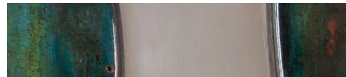
Buho ..... página 38 Serie 2010 - 2016 Mixta acero Inoxidable, cerámica rakú y madera. (Altura, largo, prof.) 40 cm x 28 cm x 15 cm.