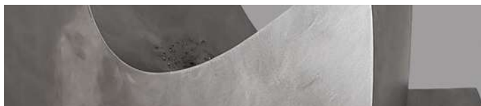
Minotauro ..... página 36 Serie 2010 - 2016 Acero inoxidable y granito. (Altura, largo, prof.) 242 cm x 116 cm x 88 cm.