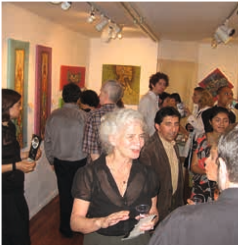
New York / 2007: 207 Arte Gallery.