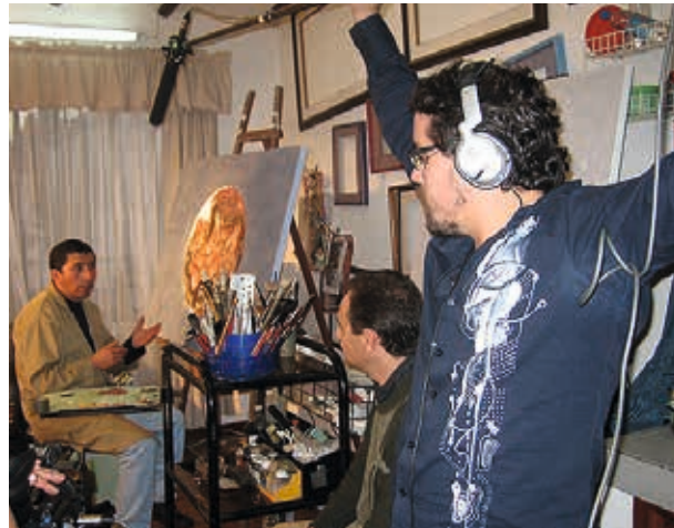
Estudio del artista / 2007: entrevista.