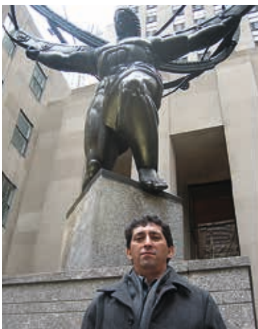
New York / 2007: Rockefeller Center.