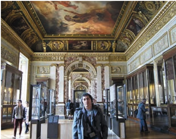
París / 2013: Versailles.