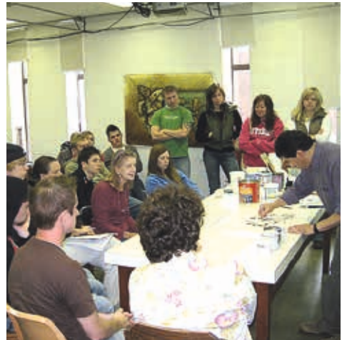
Viterbo / 2008: clases maestras a estudiantes de artes.