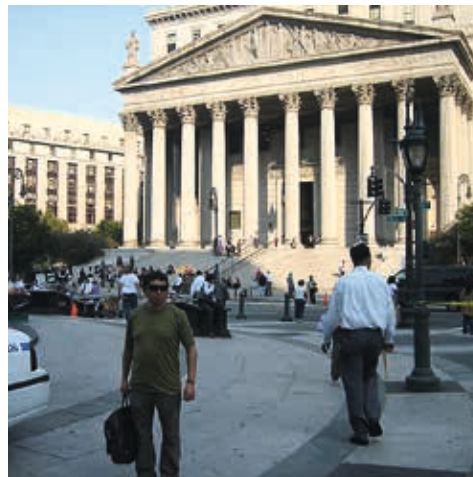
New York / 2010: Palacio de Justicia.