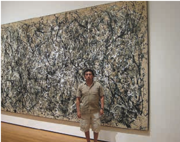
New York / 2010: museo MOMA.