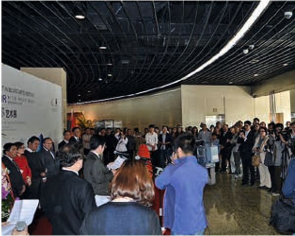
Beijing / 2013: inauguración Meet in Beijing.