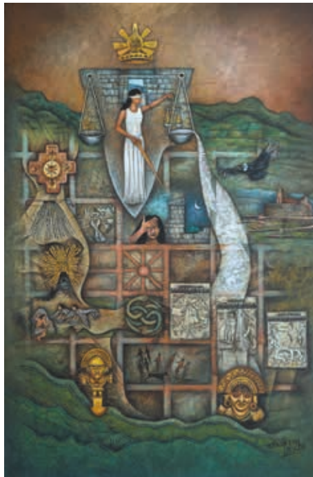
MURAL EN LIENZO AUTOR: Hernán Illescas TÍTULO: EDADES DE LA JUSTICIA LA PIEL DE LA VERDAD MEDIDAS: 1,80 x 2,65 m. AÑO: 2014 ECUADOR