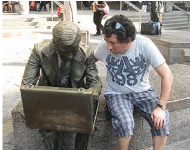
New York / 2010: Zona 0.