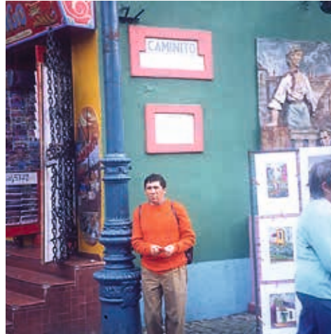
Buenos Aires / 2005: barrio La Boca, calle el Caminito.