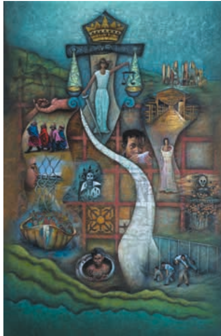
MURAL EN LIENZO AUTOR: Hernán Illescas TÍTULO: EDADES DE LA JUSTICIA MIGRACIONES MEDIDAS: 1,80 x 2,65 m. AÑO: 2014 ECUADOR