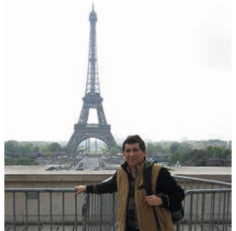
París / 2013: Torre Eiffel.