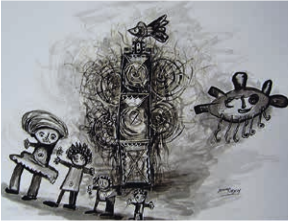
CÓDIGO: 0827 AUTOR: Hernán Illescas TÍTULO: SIMBOLOGÍA DE LOS SUEÑOS TÉCNICA: Tinta MEDIDAS: 65 x 50cm. AÑO: 2014 ECUADOR