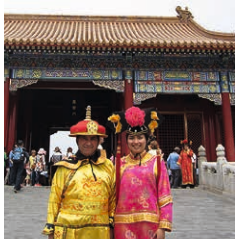
Beijing / 2013: la ciudad prohibida.