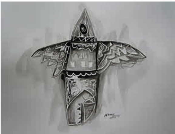
CÓDIGO: 0792 AUTOR: Hernán Illescas TÍTULO: SIMBOLOGÍA DE LOS SUEÑOS TÉCNICA: Tinta MEDIDAS: 65 x 50cm. AÑO: 2013 ECUADOR