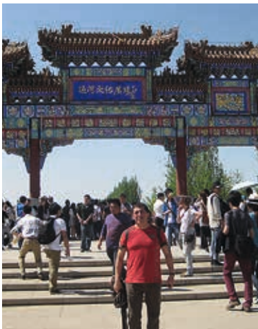
Beijing / 2013.