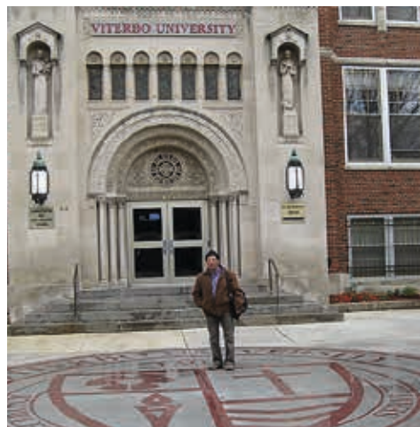
Lacrosse Wisconsin / 2008: Universidad de Viterbo.