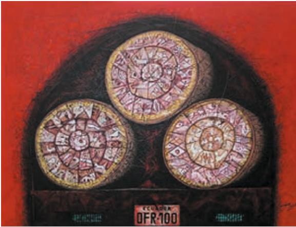
CÓDIGO: 0764 AUTOR: Hernán Illescas TÍTULO: DEFORESTACIÓN TÉCNICA: Acrílico MEDIDAS: 130 X 100cm. AÑO: 2013 ECUADOR