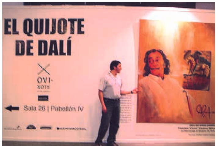
Buenos Aires / 2005: Galería del Pacífico.