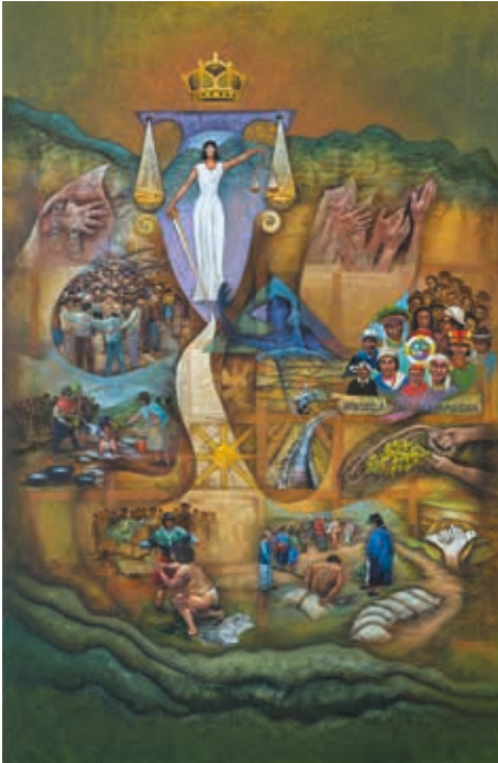
MURAL EN LIENZO AUTOR: Hernán Illescas TÍTULO: EDADES DE LA JUSTICIA MESURA DE LA LIBERTAD Y JUSTICIA INDÍGENA MEDIDAS: 1,80 x 2,65 m. AÑO: 2014 ECUADOR