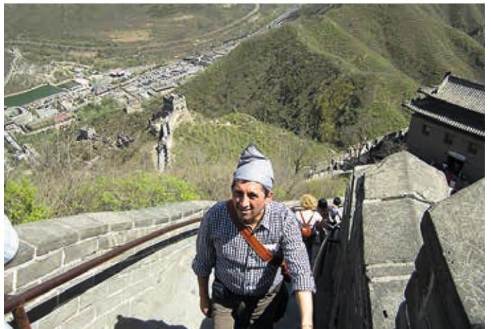
China / 2013: la Muralla China.