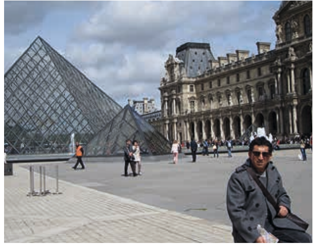
París / 2013: Museo de Louvre.