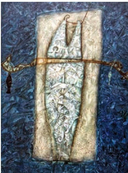
CÓDIGO: 014 AUTOR: Hernán Illescas TÍTULO: PEZ EN VEDA TÉCNICA: Óleo MEDIDAS: 120 X 90cm. AÑO: 2000 ECUADOR