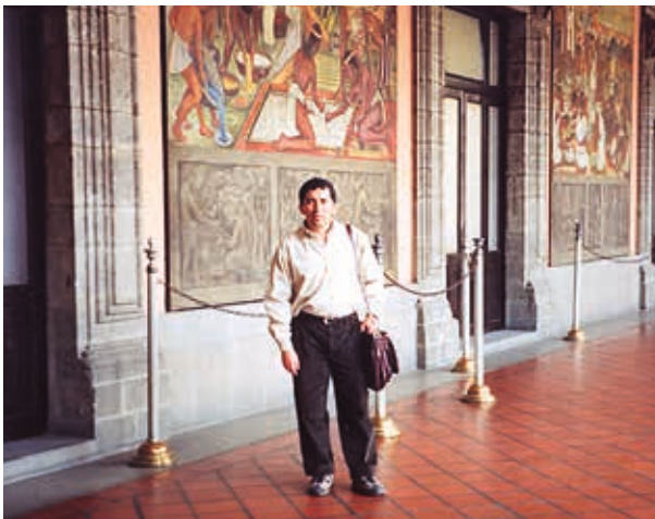
México / 2002: murales Diego Rivera.