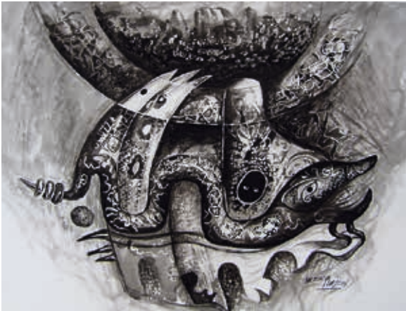
CÓDIGO: 0828 AUTOR: Hernán Illescas TÍTULO: SIMBOLOGÍA DE LOS SUEÑOS TÉCNICA: Tinta MEDIDAS: 65 x 50cm. AÑO: 2014 ECUADOR