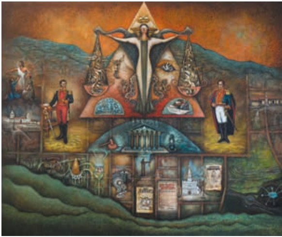
MURAL EN LIENZO AUTOR: Hernán Illescas TÍTULO: EDADES DE LA JUSTICIA ELOGIO A CUENCA MEDIDAS: 5,00 x 4,00 m. AÑO: 2014 ECUADOR