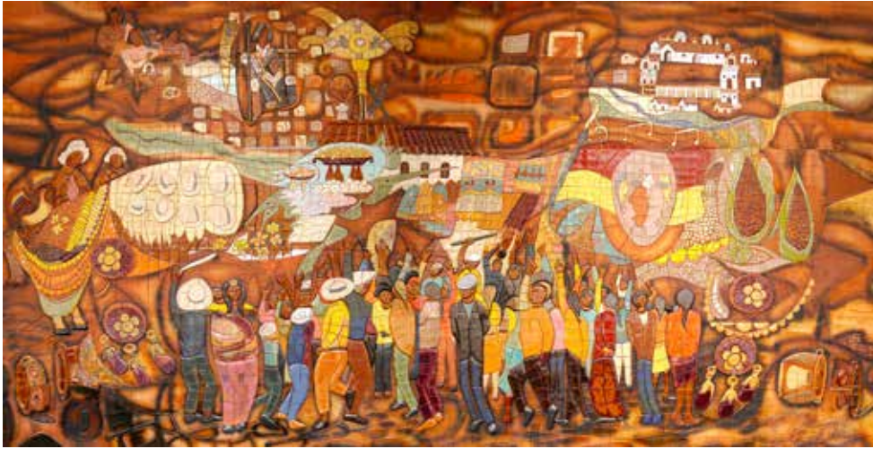
MURAL EN CERÁMICA (GOBERNACIÓN DEL AZUAY) AUTOR: Hernán Illescas TÍTULO: IDENTIDAD MEDIDAS: 7,00 x 3,50 m. de alto AÑO: 2009 ECUADOR