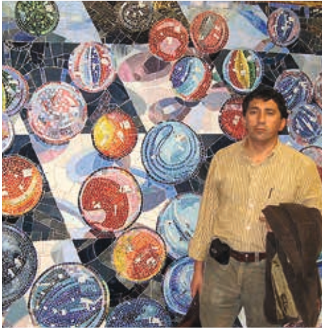
New York / 2007: Grand Central.