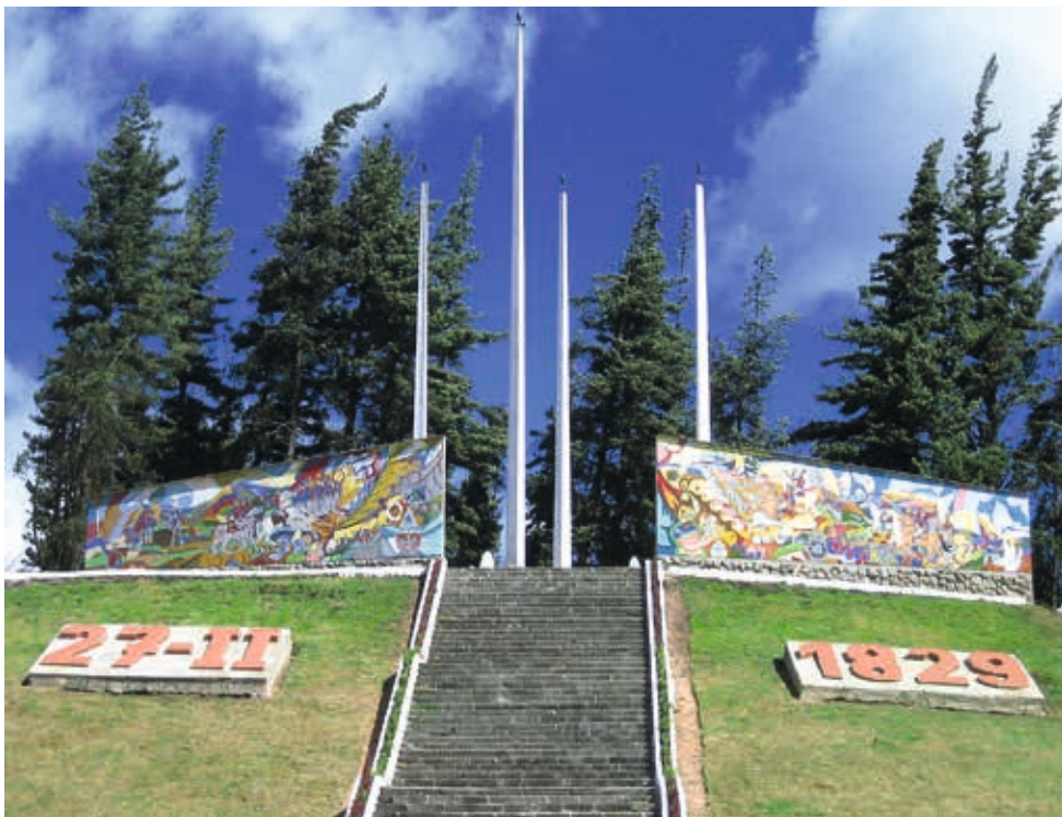
MURAL EN CERÁMICA (PORTETE DE TARQUI) AUTOR: Hernán Illescas TÍTULO: BATALLA DE TARQUI MEDIDAS: 10,00 x 3,00 m. de alto cada uno. AÑO: 2009 ECUADOR