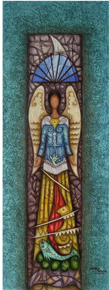
TÍTULO: ÁNGEL DE BONDAD TÉCNICA: Óleo MEDIDAS: 120 X 45cm. ECUADOR