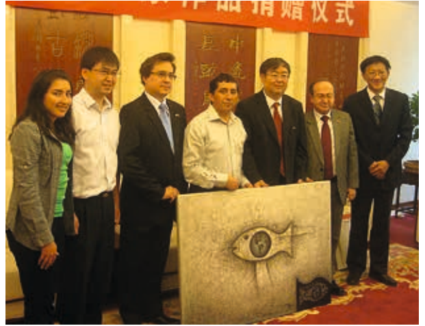
Beijing / 2013: donación al CAEG.