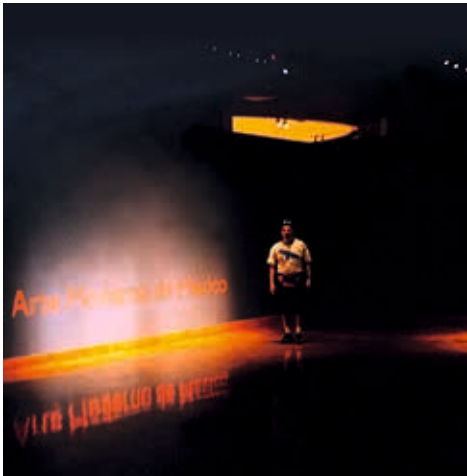
México / 2002: Museo de Arte Moderno.