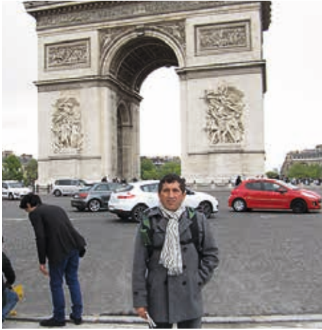
París / 2013: Arco del Triunfo.