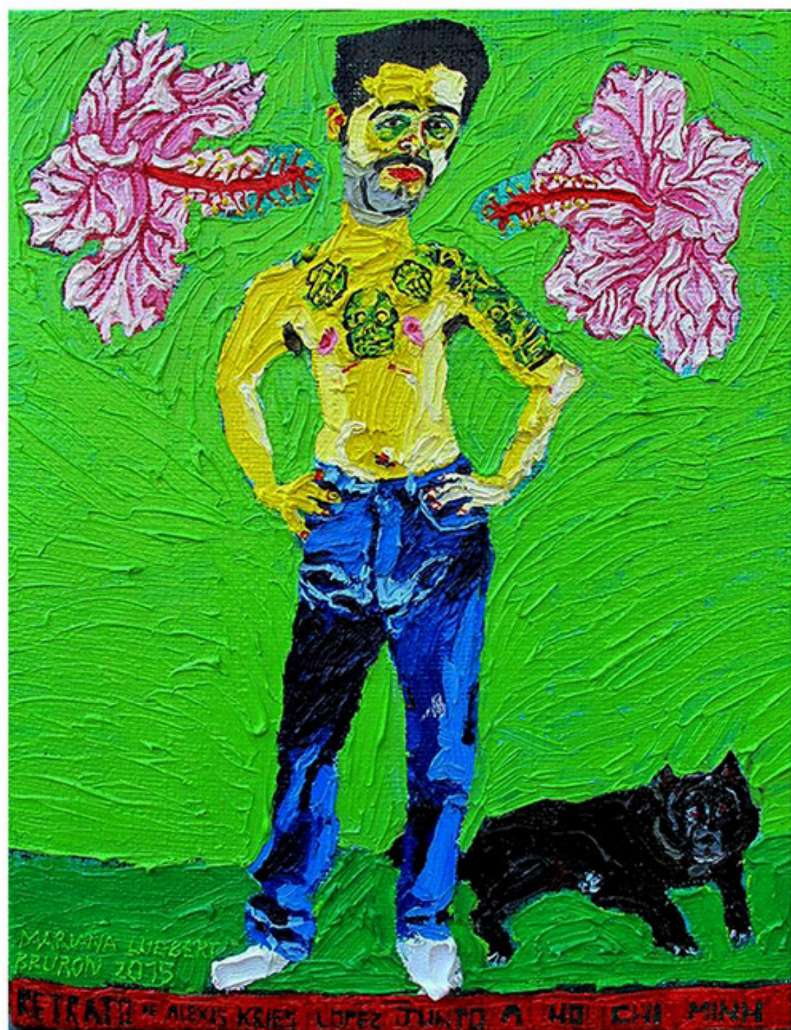
“Alexis Kries López junto a Ho Chi Minh” 50 x 39,5 cm, óleo sobre tela 2015.