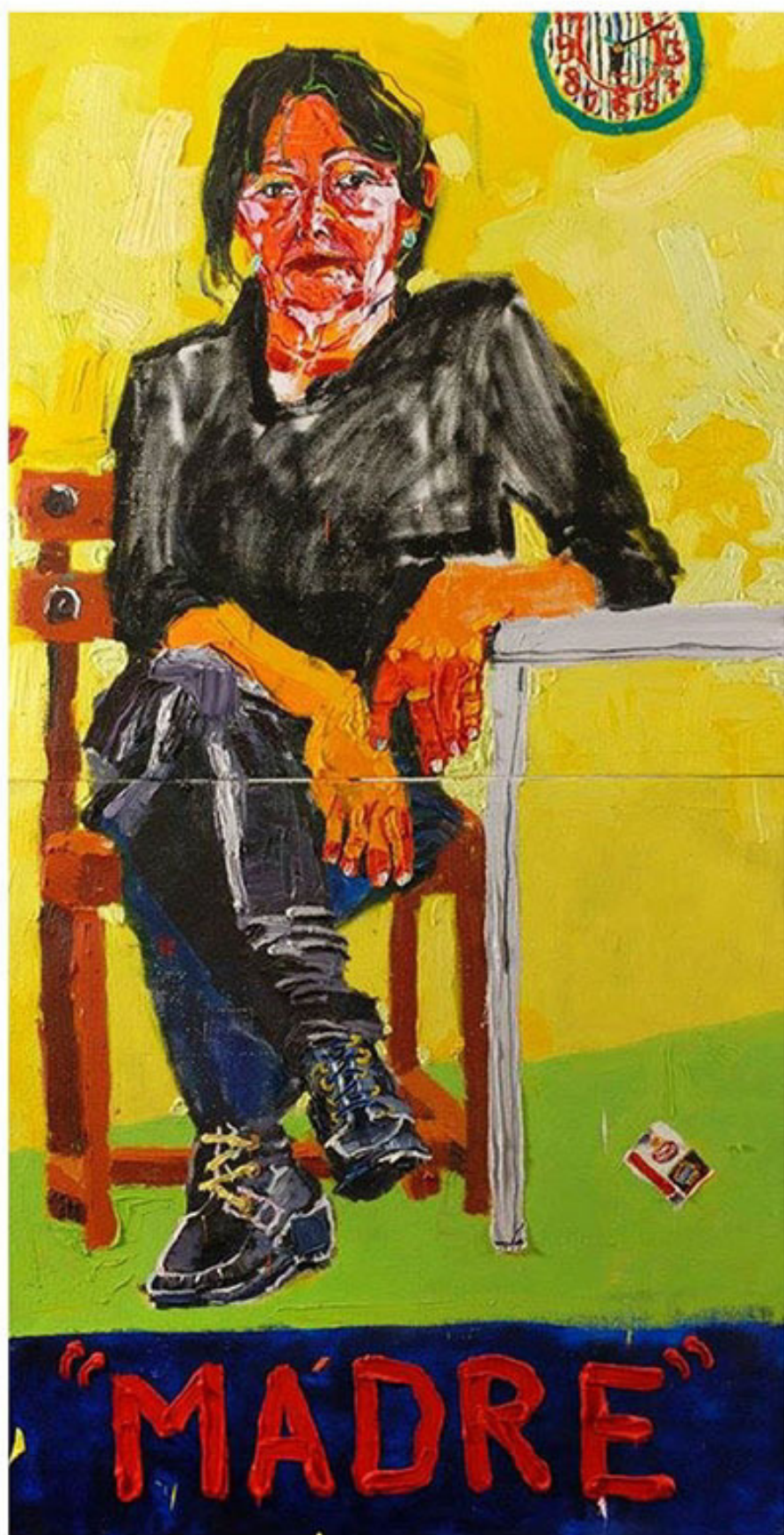
“Madre”, 200 x 100 cm, óleo sobre tela, 2015.