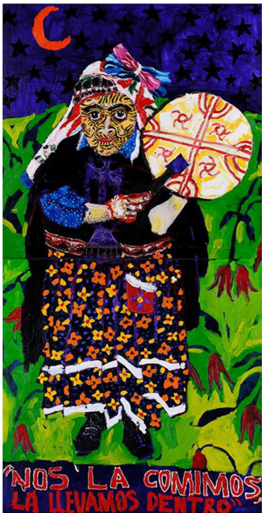
“Mujer Mapuche”, 200 x 100 cm, óleo sobre tela, 2012.