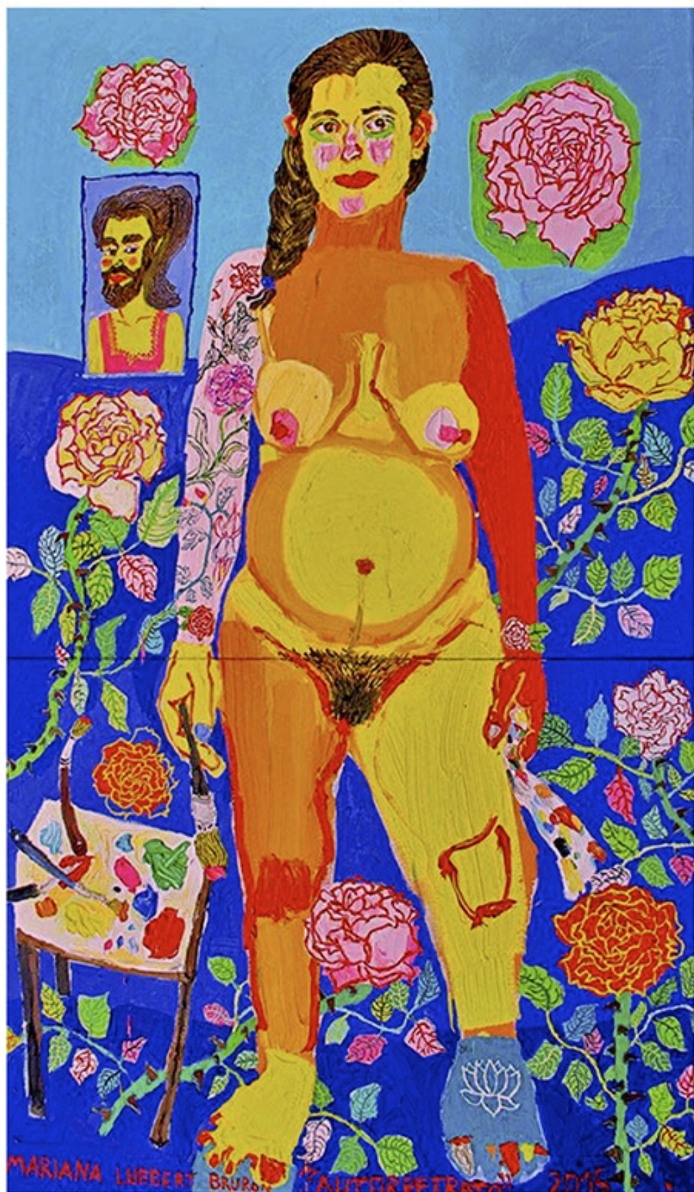
“Autorretrato embarazada”, 200 x 130 cm, óleo sobre tela, 2015.